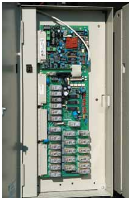
El mòdul de control SGC instal·lat al quadre elèctric de maniobra és la interfície entre els reguladors i el servei de manteniment o controladors del sistema

La connexió entre el quadre i l'ordinador dels Serveis Tècnics municipals es va fer via mòdem GSM. També es